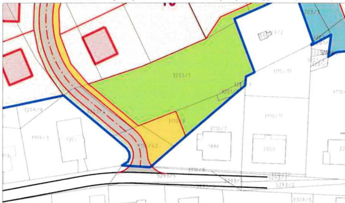
Obr. 2: US3 Urbanistické řešení – přístup do území BI28 z ul. Polní přes pozemky p. č.3110/42 a 3203/4