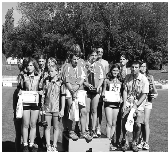
Už na stupínku pro vítěze, až do posledních okamžiků jsme nevěřily že se nám to podařilo...