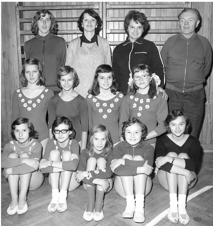
Oddíl sportovní gymnastiky 1975