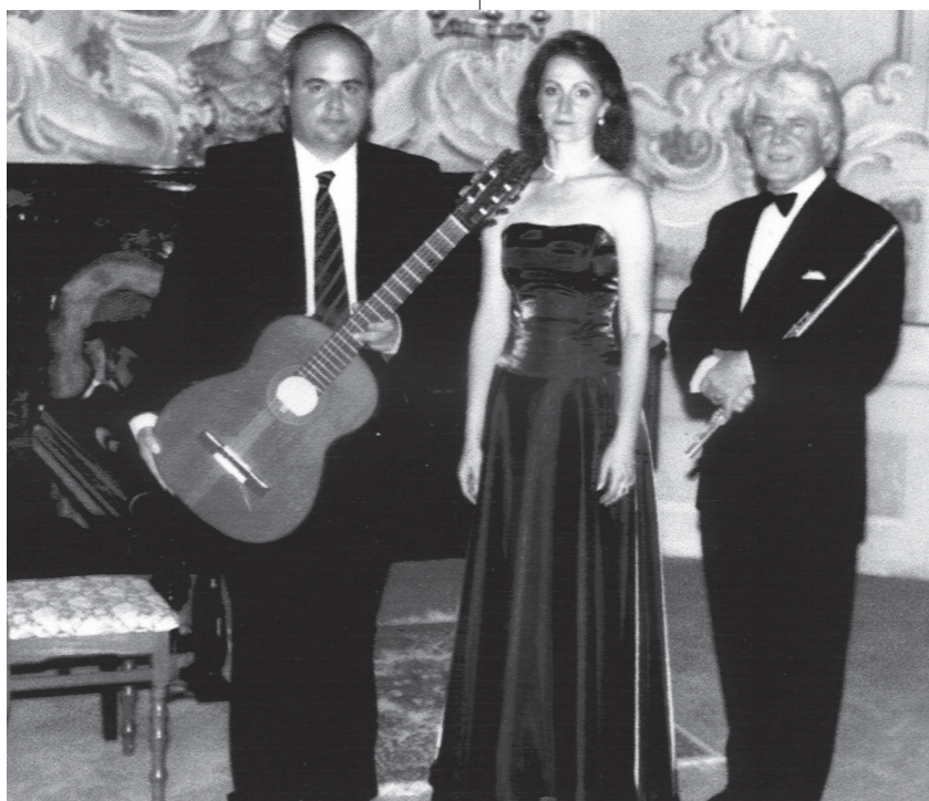
Trio Bel Canto