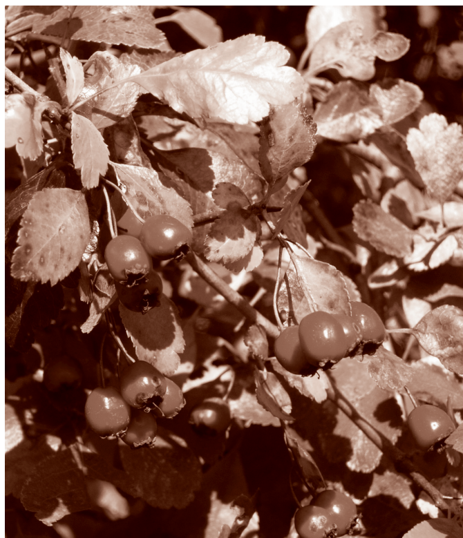
Ilustrační foto Radka Štalmachová