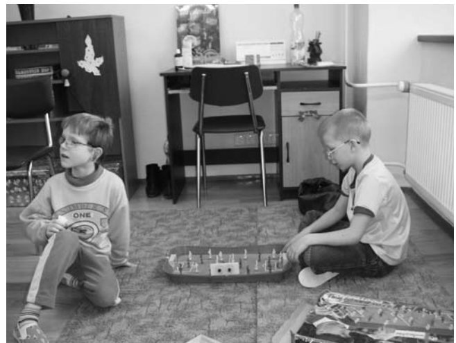
V družině, která je součástí dětského domova, si děti hrají, než přijdou rodiče.