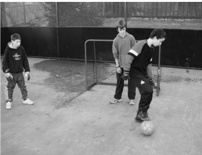
Na nově zrekonstruovaném hřišti u domova si kluci trénují své fotbalové dovednosti.