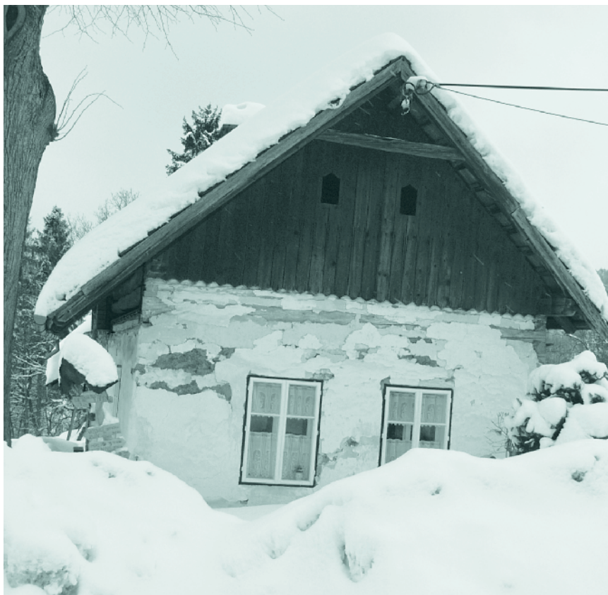
Přijde zima... PŘIJDE ????? Dočkáme se ještě zimy? Předložská zima