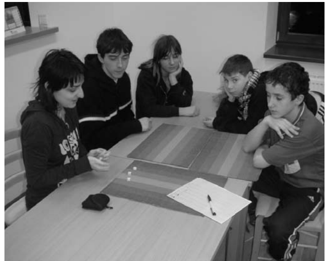
Odpoledne tráví děti hrami, učením nebo sportem.