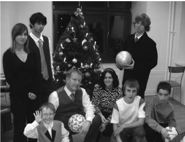
U vánočního stromčeka se s dětmi setkal pan Josef Slovák, náměstek hejtmána Zlínského kraje.