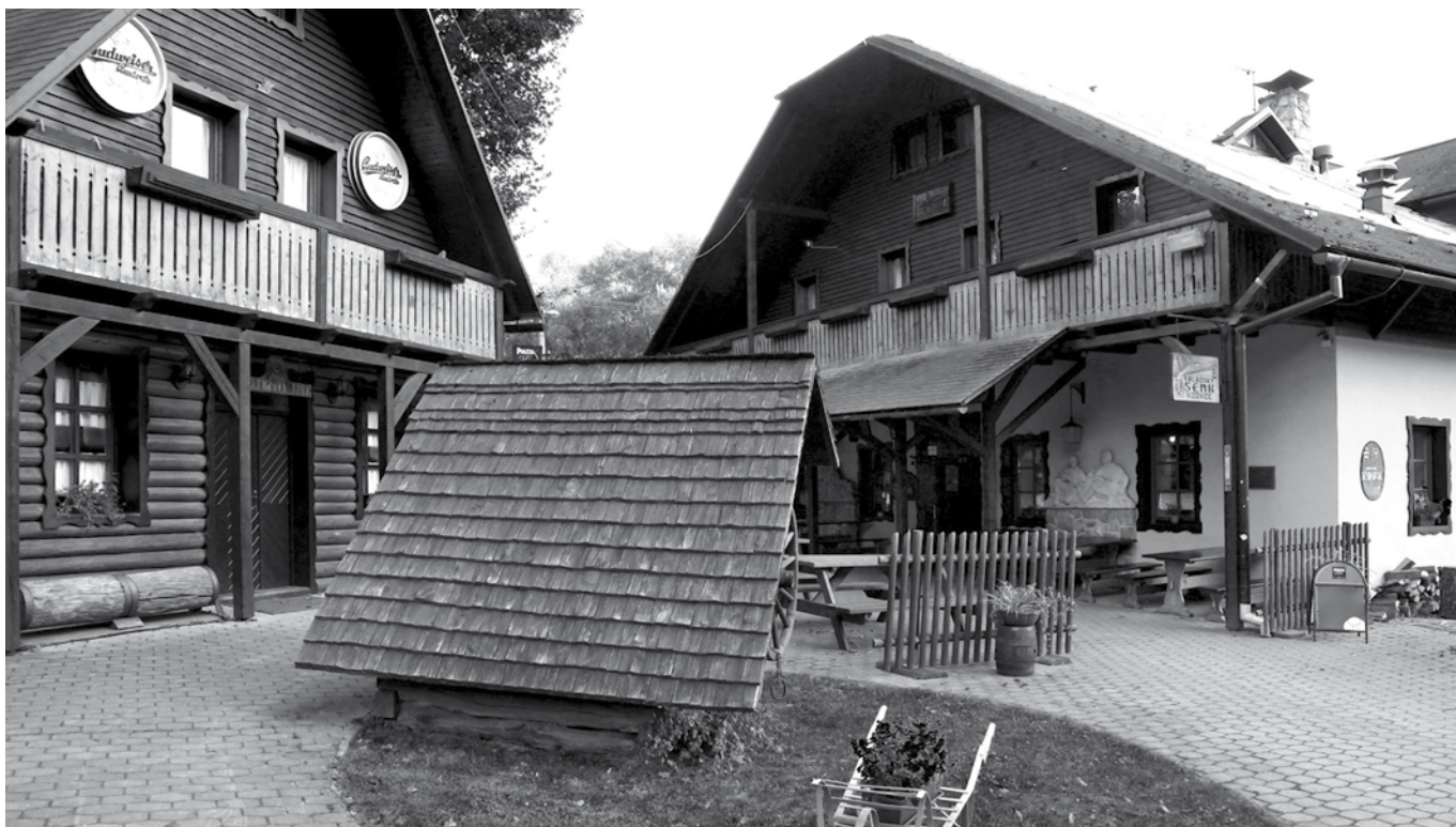
Vizovice, Valašský šenk, září 2010, foto Radek Mládenka.