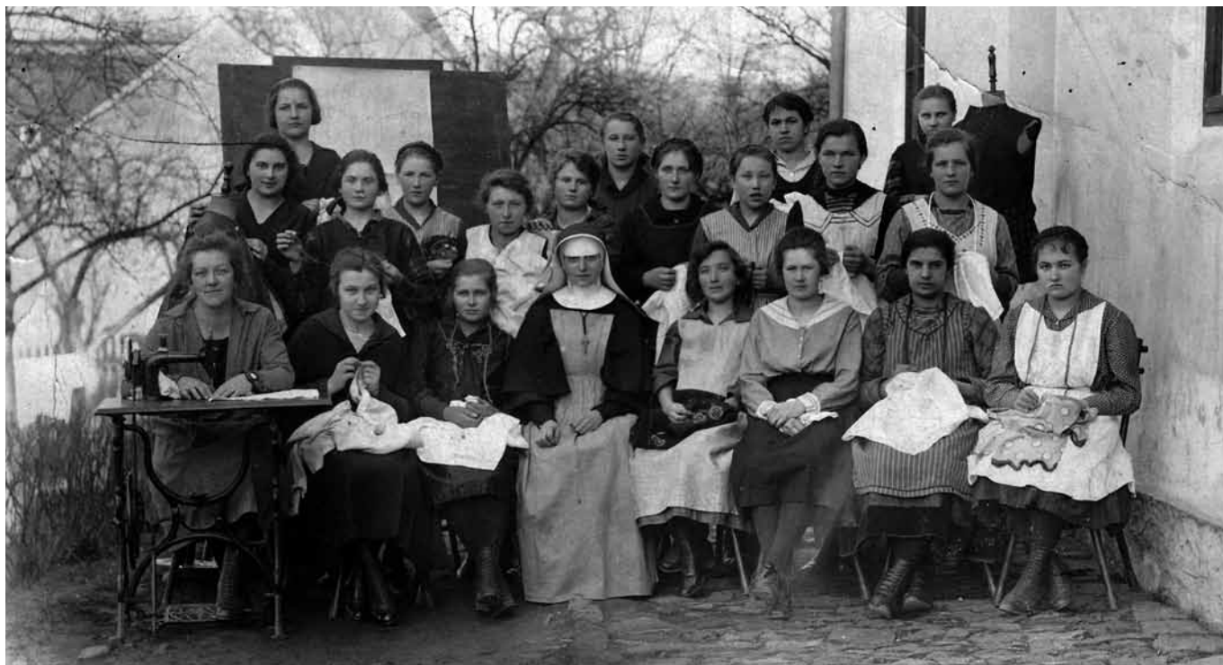
Kurz šití v klášteře naproti nemocnici Milosrdných bratří dnes Domov mládeže, na fotografii hospodyňky a mladé ženy. Foto z let 1935–1938.