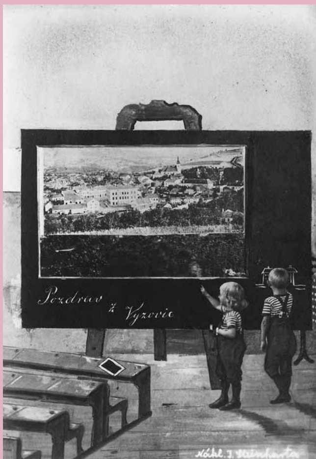
Vizovice, 1905, vydal J. Steinhart, ze soukromé sbírky zapůjčil Jiří Madzia.

Listina, kterou Maximilian druhý, z boží milosti volený římský císař, po všecy časy rozmnožitel říše a Uherský, Český, Dalmatský, Chorvatský král etc. vysadil Vizovice na město, byla vydána „ve středu, den obrácení sv. Pavla na víru křesťanskou“, tedy v měsíci lednu, ale připomínka tohoto výročí nás provází po celý rok 2010.