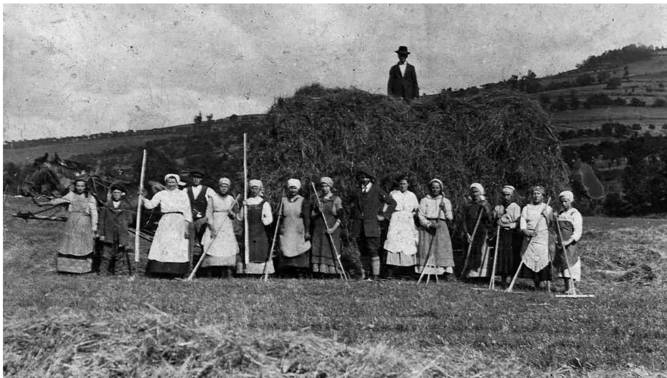
Svážení sena na Razově pod Těchlovem. Foto z roku 1938.

Dočasné úspěchy německých armád stupňovaly sebevědomí nacistů, kteří věřili v Hitlerovu tisíciletou Říši. Potlačovali jakoukoliv zmínku o ČSR jejich představitelích, ba i Dějiny Palackého byly K. H. Frankem odsouze-