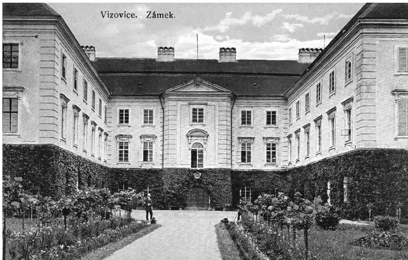
Vizovice, 1924, vydal Rudolf Macháček, ze soukromé sbírky zapůjčil Jiří Madzia.

V tomto roce bylo dosaženo 1 000 m. Co přinese tento vrt a jakým způsobem ovlivní pak další vývoj našeho města, nedovedeme zatím odhadnout. V první polovině září před druhým Trnkobraním byla celá plocha náměstí Svobody (přejmenováno bylo náměstí Rudé armády na náměstí Svobody někdy v průběhu roku 1969) asfaltována. Městský národní výbor pořídil větší počet košů na odpadky a dal je rozmístit kolem náměstí, aby se čistota náměstí zlepšila. Opravou fasád novorenesančních domů na náměstí Svobody i dokončením úprav plochy celého náměstí jeho vzhled velmi získal. Mění se tvář našeho města a nejlépe to posílehnou ti, kteří se k nám po letech vracejí. Naše město v minulých stoletích těžce zkoušené ničivými vpády i přírodními živly, vždy vyrůstalo do krásy stále větší a větší.