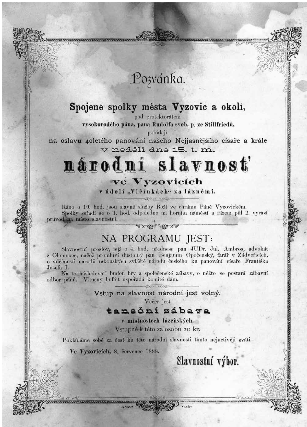
Pozvánka na národní slavnost konanou na oslavu panování císaře Františka Josefa ve Vyzovicích Rok 1888.