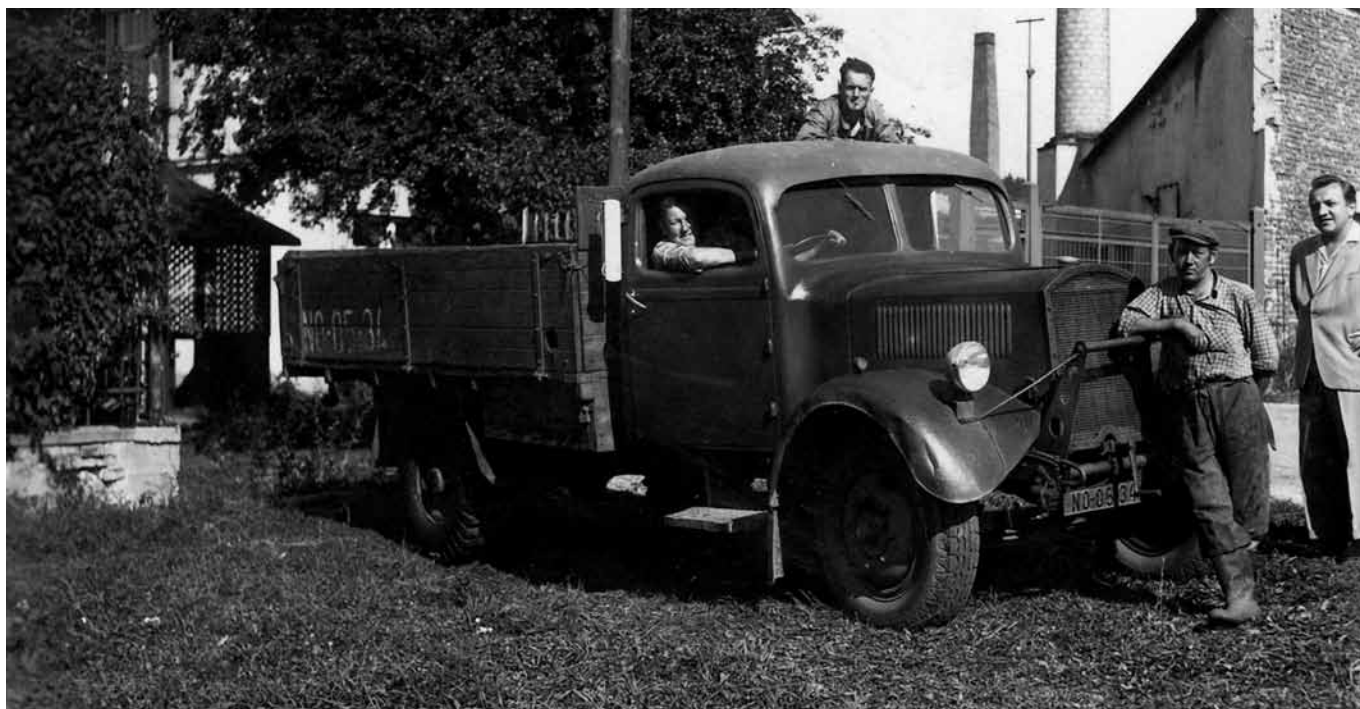
Firma Jelínek Razov. Erena, automobil řidiče Bedřicha Hajta, používaná na rozvoz výrobků. Foto z roku 1946.

Při volbách 30. května 1948 bylo pro jednotnou kandidátku odevzdáno 1 237 hlasů, tak zvaných bílých lístků bylo 752 a neplatných hlasů