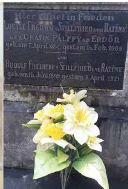
Náhrobní kámen na hřbitově ve Vizovicích