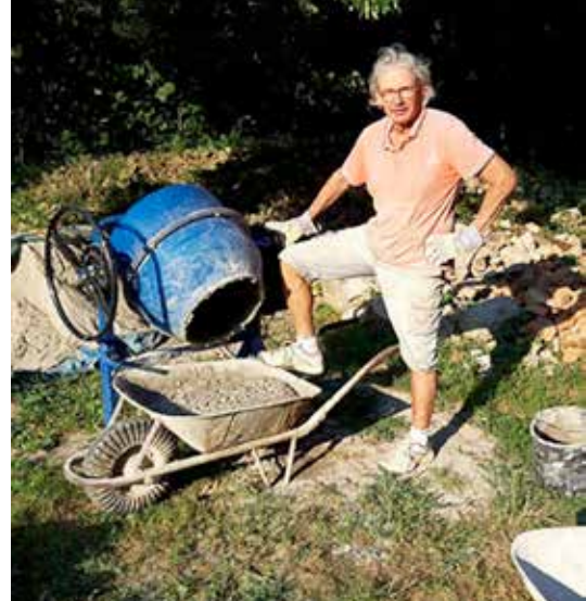
Autor článku - hlavní kalfasník