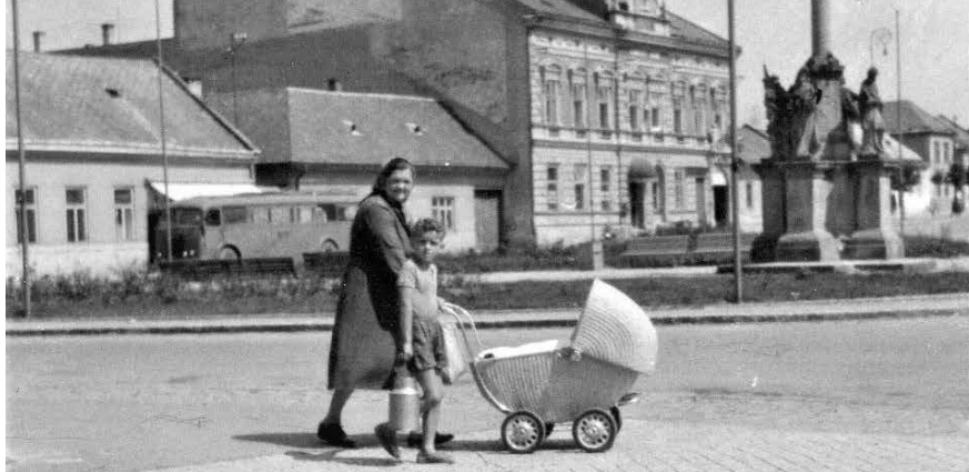
Vizovice, Masarykovo náměstí – konec 50 let 20. století