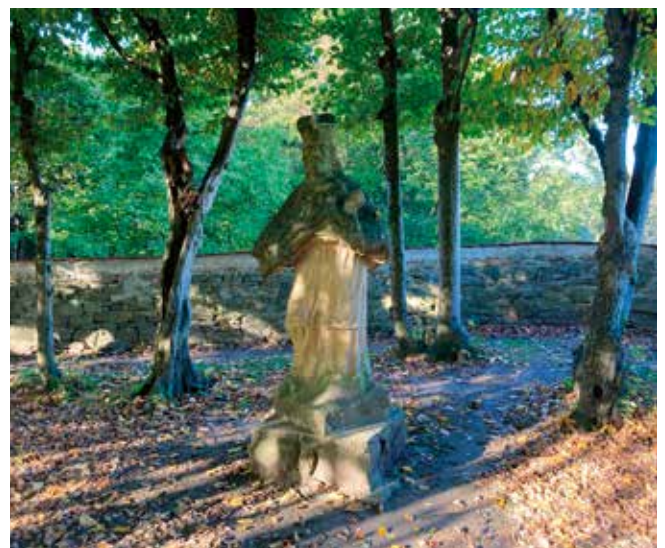
Sv. Jan Nepomucký před restaurováním, říjen 2021