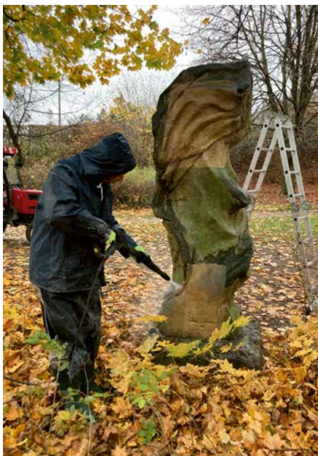
Čištění zadní partie sochy sv. Václava