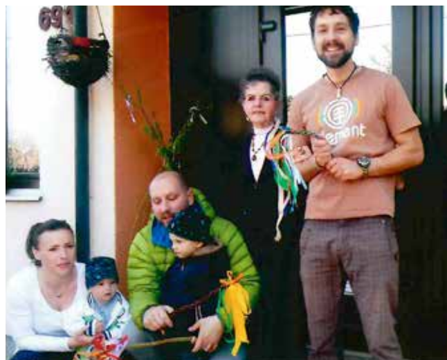
Velikonoce v r. 2017 s nejmladšími členy rodiny