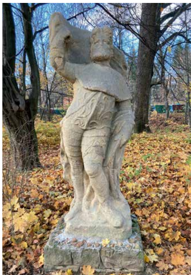
Sv. Václav po omytí