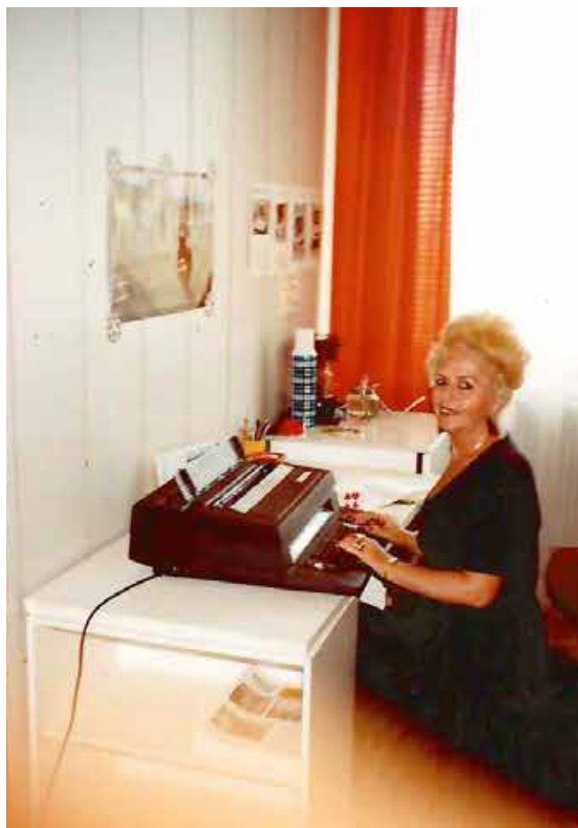
v Agrokombinátu Slušovice