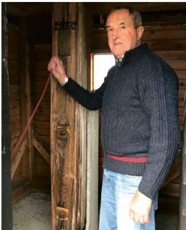
František při zvonění poledne

První zvon darovaný hraběnkou z Vizovic byl instalován hned po vystavění zvonice v roce 1887. Za první světové války ho však místní ze strachu, že o něj přijdou, zakopali. Mohl tak po válce zvonit dál. Zvonil i v nově zrekonstruované zvonici po roce 1928, kdy se rozebrala původní šestihřanná konstrukce a postavila se nová zvonice ve tvaru obdélníku. Původní tehdy zůstal jen dubový rozsoch, na kterém zvon visí. Dozvonil však za druhé světové války, když už se nikdo neodvážil zvon schovat a byl odevzdán pro vojenské účely. Byl