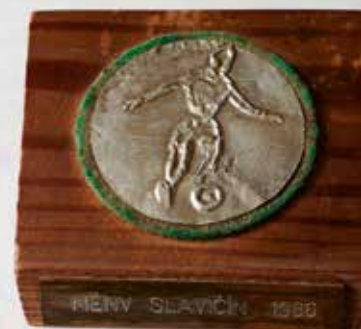
Plaketa z turnaje: MĚNV SLAVIČÍN 1966