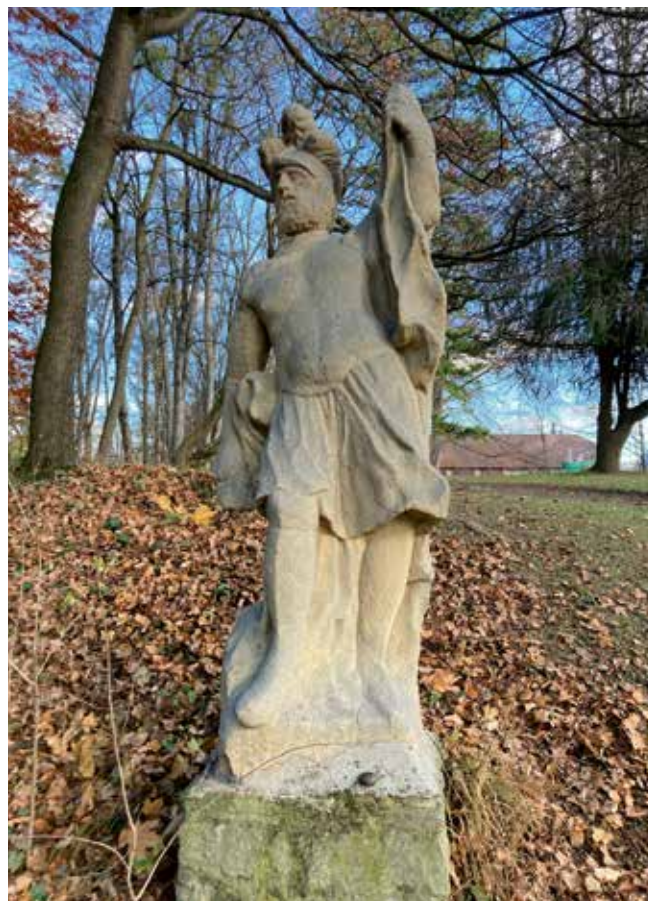
Florián po očištění od mechů a lišejníků