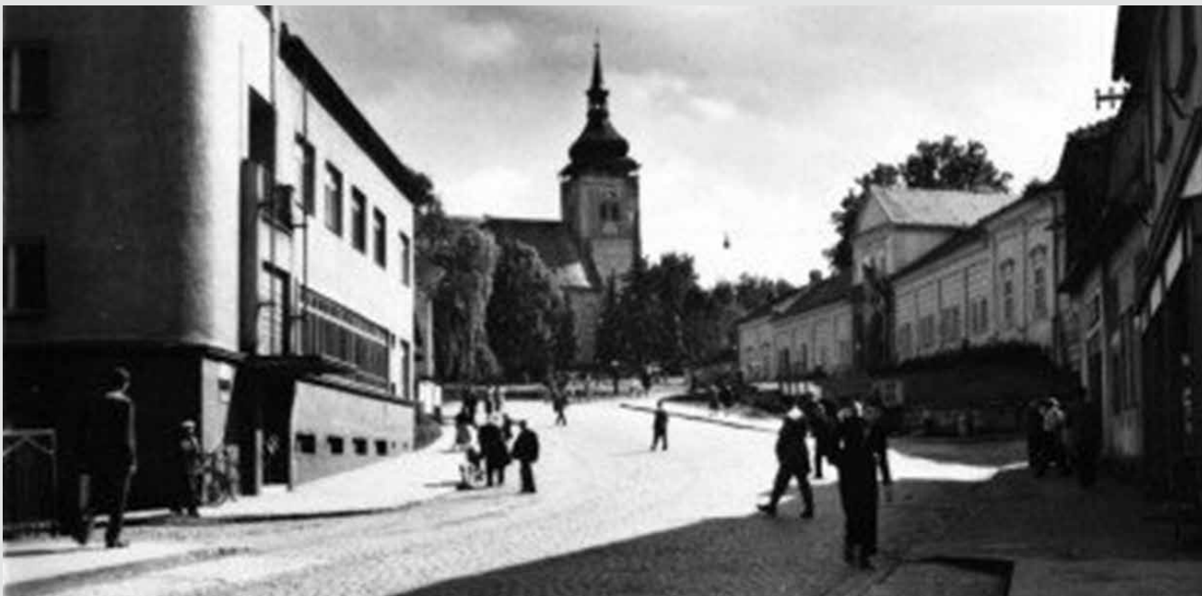
Budova pošty (vlevo) v 60. letech 20 století