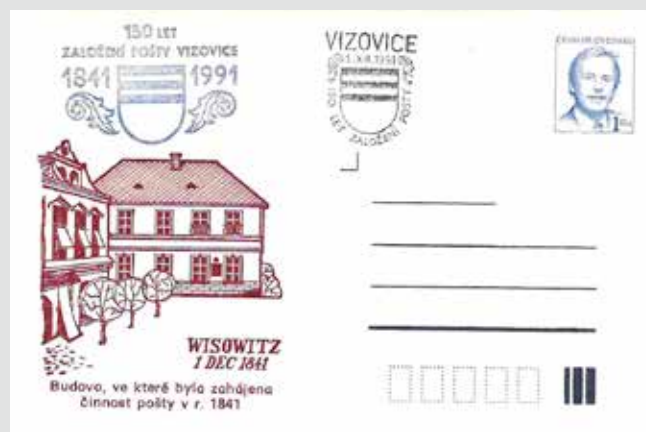
Korespondenční lístek vydaný k 150. výročí pošty ve Vizovicích