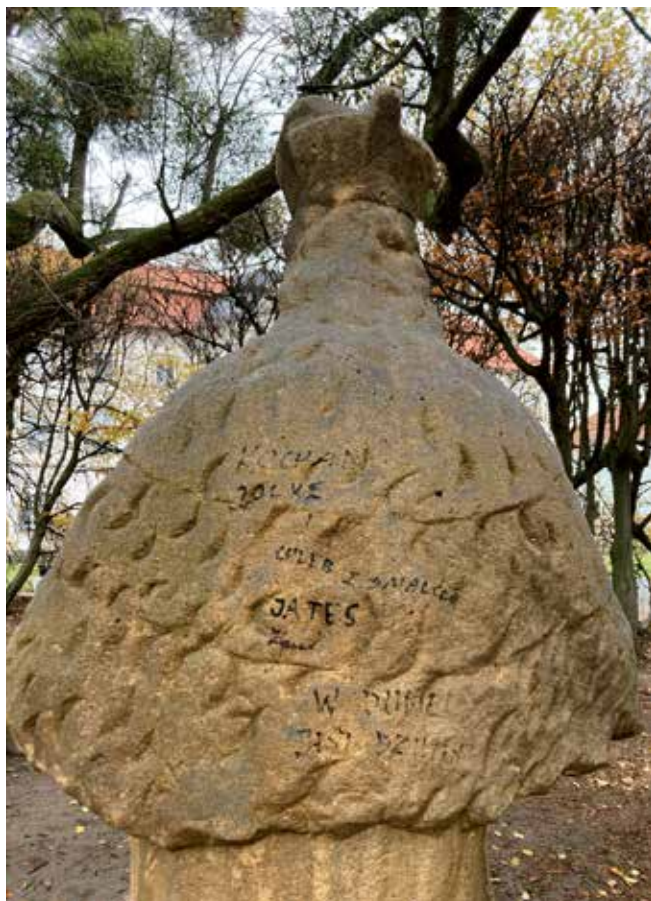
Nepomuk po omytí