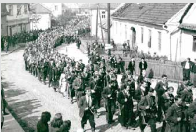
Budova pošty (vpravo) v r. 1945, konec 2. sv. války