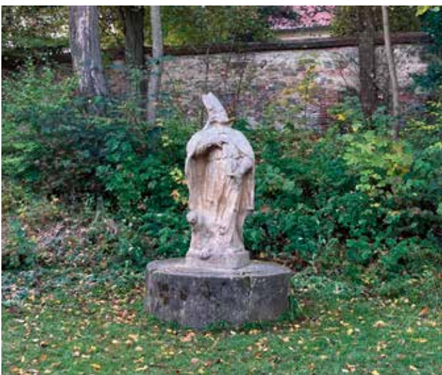
Sv. Prokop po restaurování