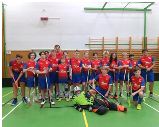
florbal příměstský tábor, dorostenci