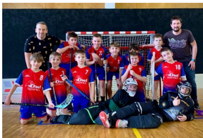
florbal mladší žáci