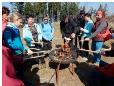
Foto – 13. ročník Jarní otvírání Doubravy 2022

Na všechny se těší KČT Vizovice a provozovatel rozhledny.