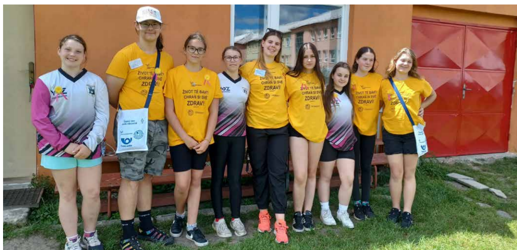
Mladí vizovičtí hasiči vybrali v ulicích města na boj proti rakovině více než 30 tisíc korun.

V ulicích města jste mohli zmíněný symbol boje proti rakovině získat od mladých