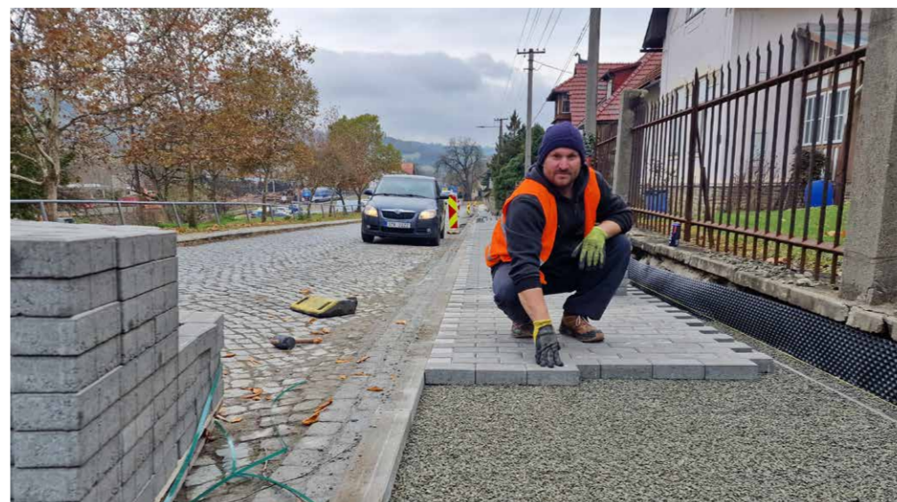
V době uzávěrky tohoto vydání probíhala pokládka zámkové dlažby. Nyní by již mělo být vše hotovo.

A výsledky ankety? Devadesát procent respondentů uvedlo jako vhodnější formát novin A4 namísto současného A3. Periodicita šestkrát do roka vyhovuje dle ankety 70 procentům respondentů a 85 procent respondentů je spokojeno i s formou doručování novin do poštovních schránek. Většinová spokojenost panuje také s náplní Vizovických novin.